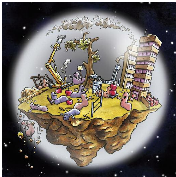
Dibujo de la novela gráfica de "Sin Palabras" de Polyp. www.polyp.org.uk - www.speechlessthebook.org

En este contexto, Amigos de la Tierra critica el lamentable fracaso de los países más industrializados ya que actualmente ni toman verdaderas medidas de reducción de sus propios GEI, ni apoyan a los países empobrecidos a reducir las suyas. A pesar de que los mercados del carbono están creados por marcos regulatorios de los gobiernos –en este caso Europa, y el Esquema de Emisiones en Comercio de la Unión Europea -, el comercio del carbono está supeditado como un mecanismo basado en el mercado. Lo que sobre el papel parece la solución menos mala, en la práctica estamos compro-