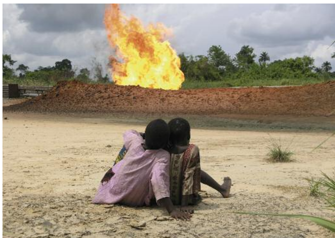
Niños del Delta del Níger observan quema de gas de Shell. Elaine Gilligan / Amigos de la Tierra

Amics de la Terra ha iniciado un proyecto para denunciar la dramática situación que vive la población del Delta del Níger en Nigeria a consecuencia de la explotación del petróleo.